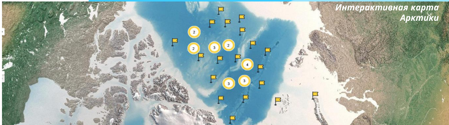
Интерактивная карта Арктики

Японский механизм , корпус из нержавеющей стали