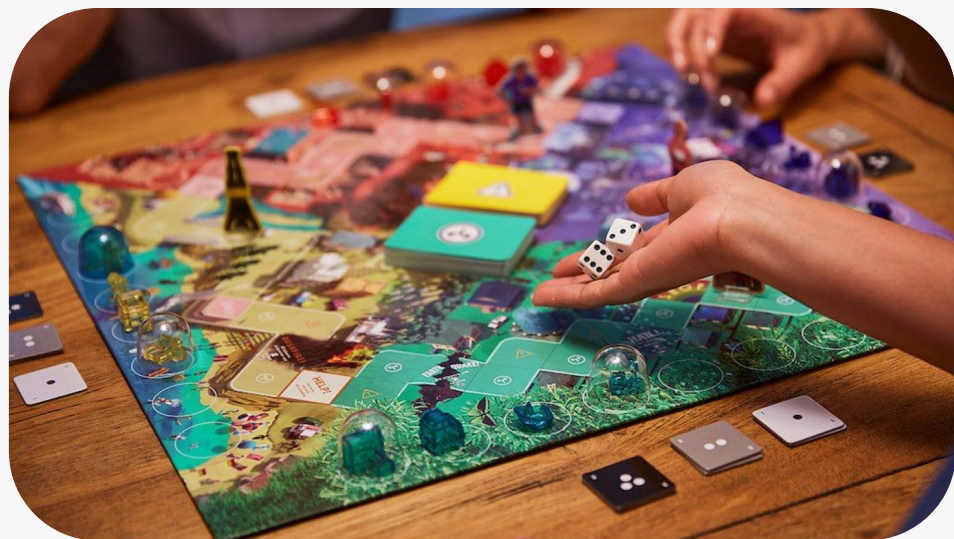
Время с семьей